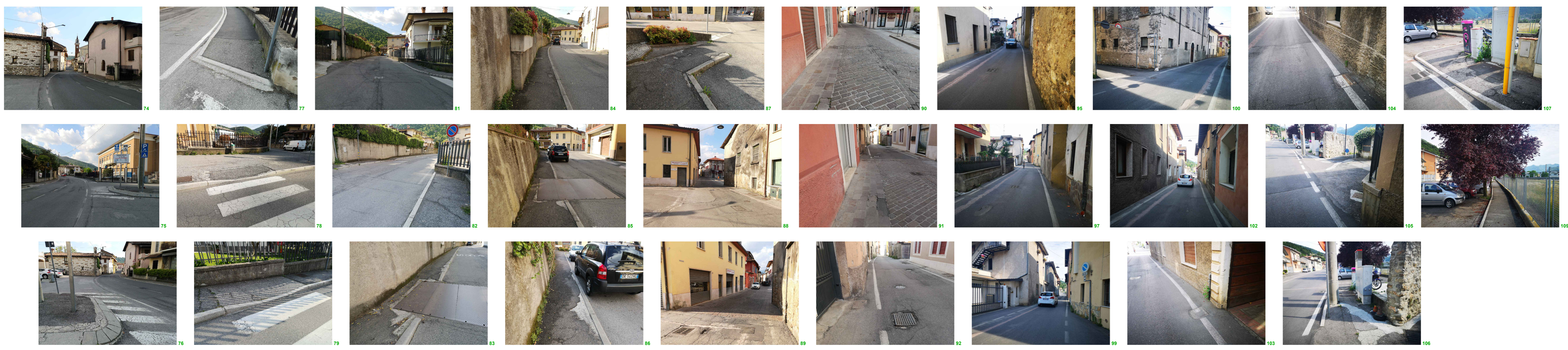
TAVOLA P 1 003

PROGETTO ARCHITETTO GUALTIERO OBERTI ARCHITETTO LUCA OBERTI Via degli Anzoni, 3 - 24010 Soronno (BS) tel 035 573120 - info@obertiarcchitetti.it ARCHITETTO GIAN PIERO PEDRETTI Via Mazzo, 1 - 24124 Bergamo (BG) tel 339 4826799 - gianpiero.pedretti@alice.it COLLABORATORI Simona Anghileri Rodolfo Farina